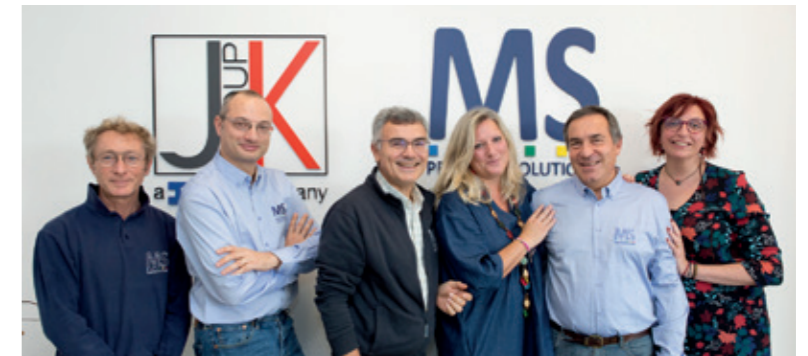
SERVICE TEAM LEADERS DI MS