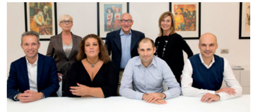
FINANCE TEAM LEADERS MS-JK