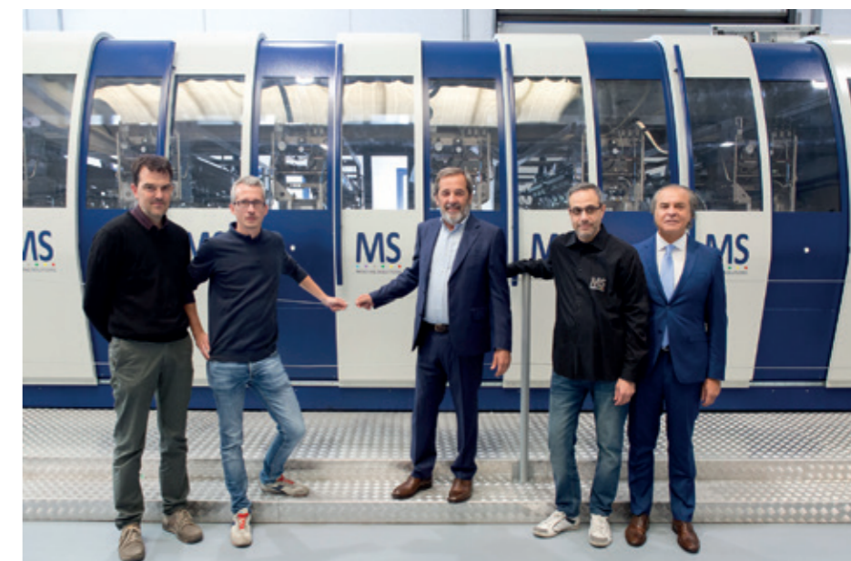
R&D TEAM LEADERS DI MS