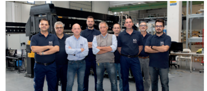
PRODUCTION TEAM LEADERS MS