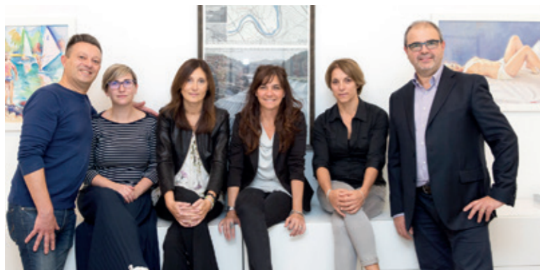
HR E PURCHASING TEAM LEADERS MS E JK

consentito di crescere ulteriormente con la tranquillità di poter agire autonomamente e senza condizionamenti. Siamo una stand-alone company, pur appartenendo a una grande realtà. La collaborazione ci ha inoltre permesso di mantenere molto ele-