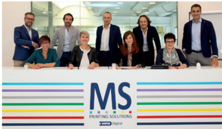
SALES TEAM LEADERS MS E JK