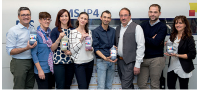
R&D PRODUCTION TEAM LEADERS DI JK